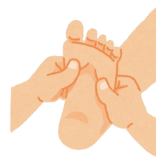
Ταϊλανδέζικη Ρεφλεξολογία Ποδιών