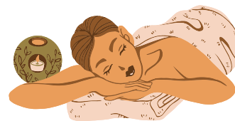
Anti Stress - Ολιστικό Μασάζ