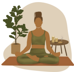
Transformational Hatha Yoga